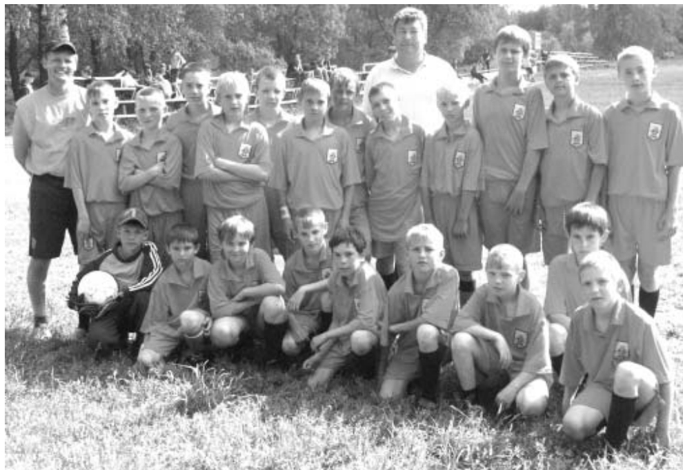
На фото: команда младших юношей со своими тренерами.