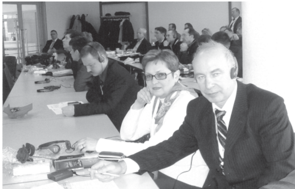
На фотографиях: Цементный завод в Ганновере; рабочий момент Международного семинара.

кандидат технических наук, технический директор ЗАО «Кондор-Эко».