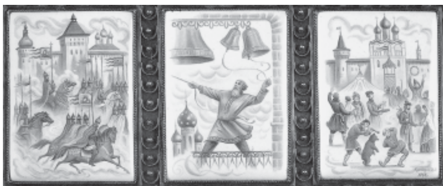
Н.А.Куландин. Триптих «Ростовские звоны»