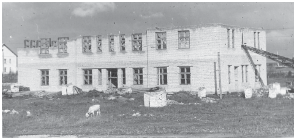
Биография в фотографиях: строительство Семибратовской больницы