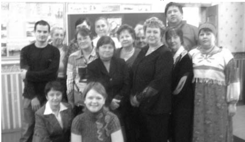
Участники семинара «Уроки Родиноведения»