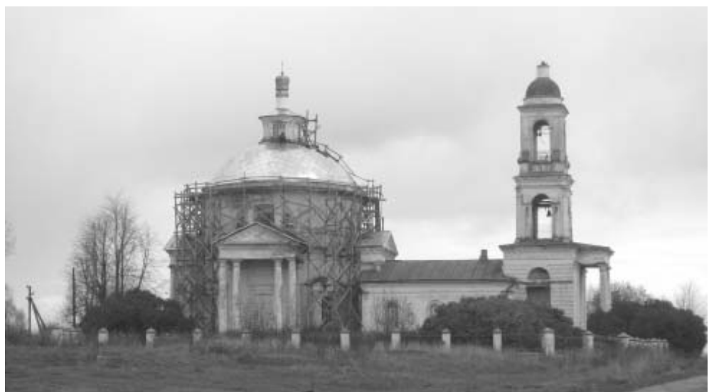
... И так храм в Татищеве выглядит сегодня