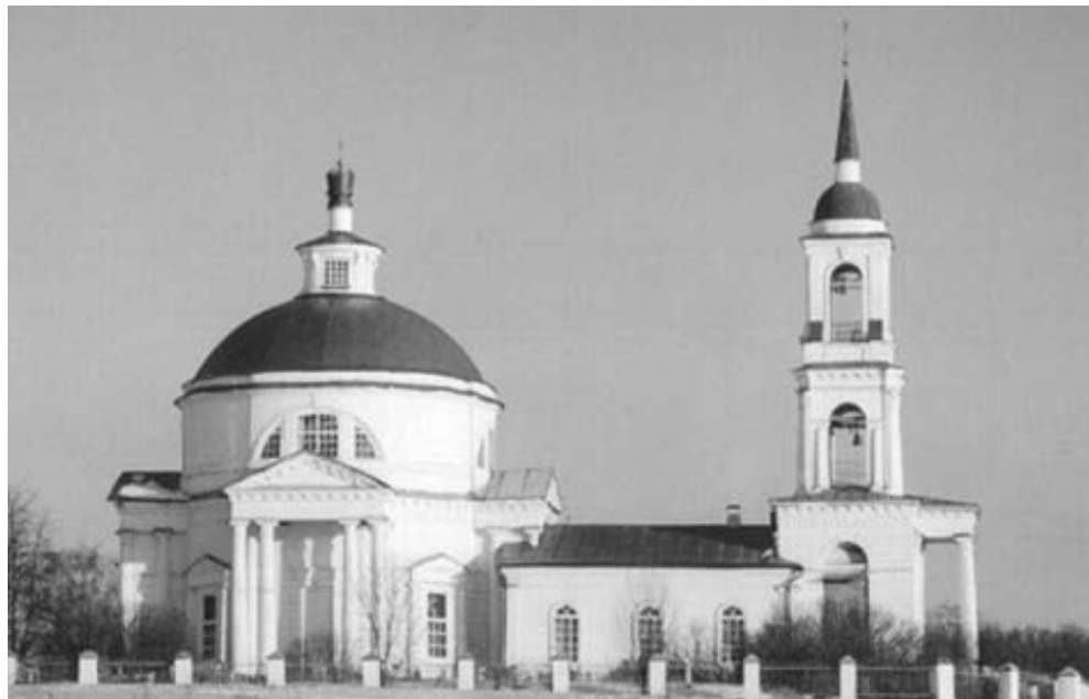
Таким храм Сергия Радонежского был совсем недавно...

После посещения Мосейцевского сельского округа, мы продолжили путешествие по окрестностям Семибратовского сельского поселения, решив на этот раз поближе познакомиться с окрестностями Татищева.