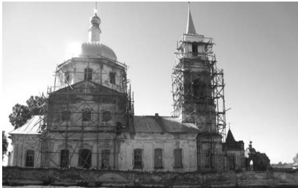
Храм Сергия Радонежского

Решив объездить окрестности Семибратовского сельского поселения, мы добрались и до его «медвежьего угла» – села Мосейцево. Загодя распечатали карту, так как маршрут для нас был незнаком, и отправились в путь. По дороге, проезжая мимо заброшенных деревень и разрушенных церквей, почувствовали себя настоящими Колумбами, открывающими Америку. Невозможно было себе представить, что граница Семибратовского поселения протянулась практически до Ивана. Так далеко! И вот, наконец, Мосейцево.