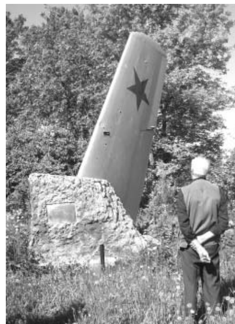
Памятник погибшим воинам