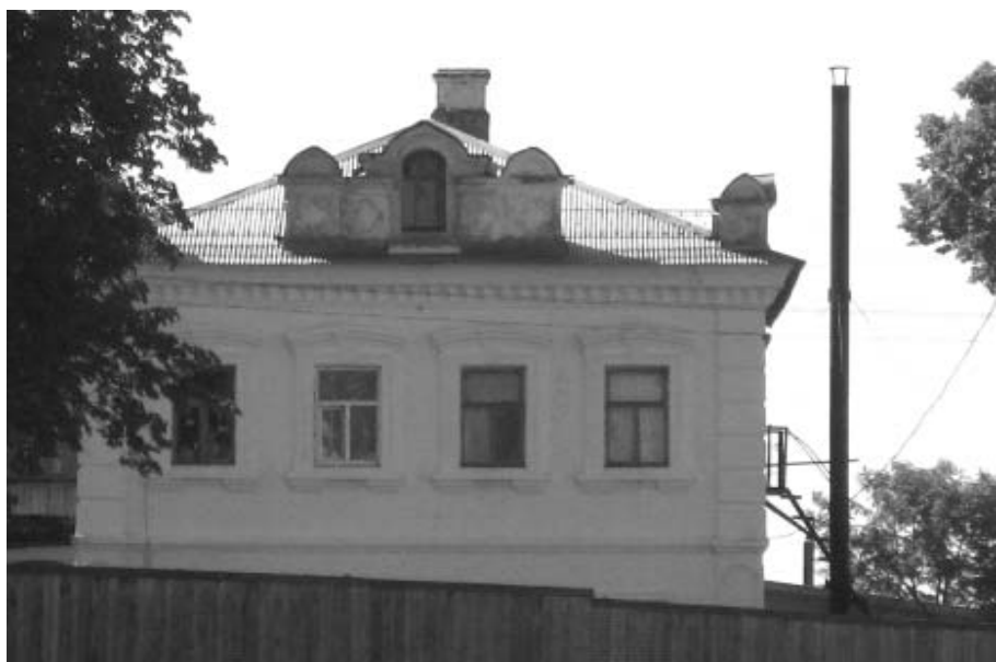
Барская усадьба, ныне приют для девочек