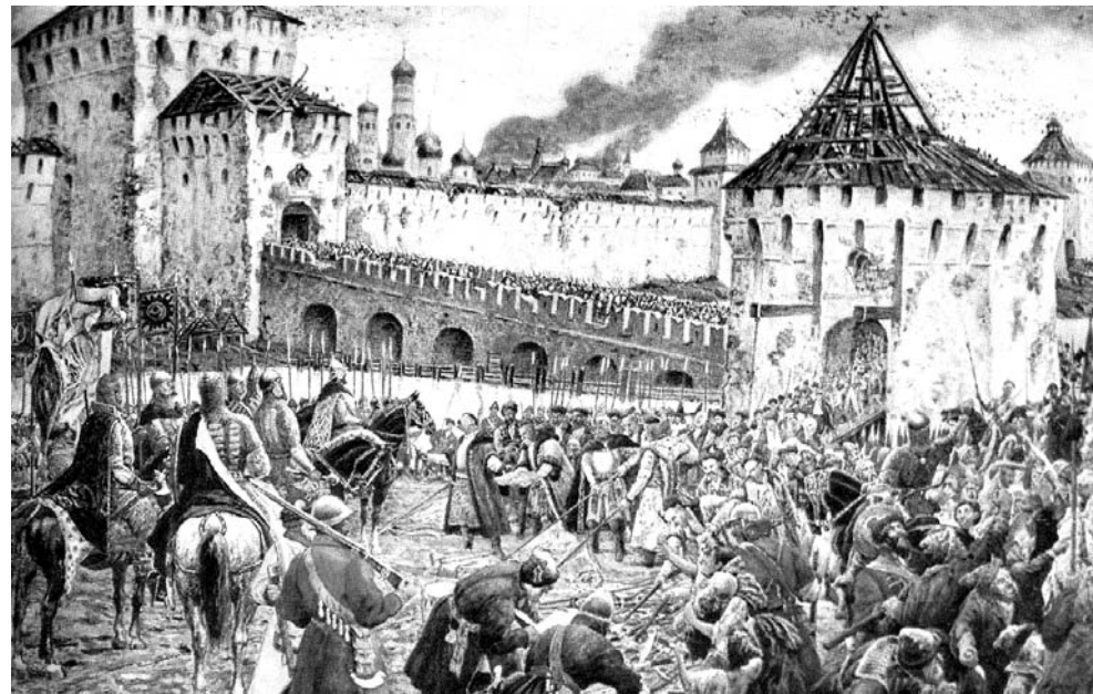
З.З. Лиссер. Изгнание польских интервентов из Московского Кремля в 1612 г.